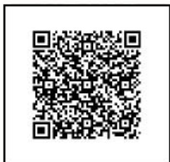
COOL CHOICE 賛同登録用QRコード