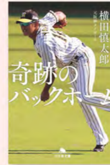
『奇跡のバックホーム』 横田慎太郎(著) 幻冬舎