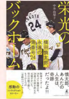
『栄光のバックホーム』 中井由梨子(著) 幻冬舎