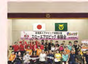
スロエアロビック体験会