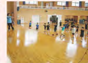
スポーツ少年団フェスタ