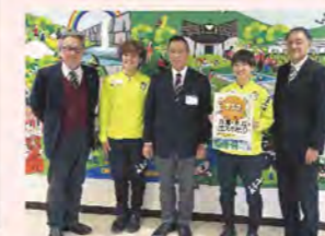
ガイアマテラス宮崎 女子サッカー選手表敬訪問