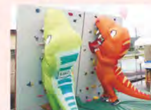
ふくしまつり ボルダリング体験会