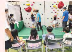
日本のひなた宮崎国スポ2年前イベントボルダリング体験会(イオンモール宮崎)