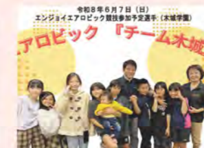
令和8年6月7日(日) エンジョイエアロビック競技参加予定選手(木城学園) 競技参加予定選手紹介(木城学園)