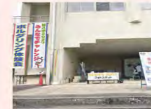
木城ふるさとまつり ボルダリング無料体験会