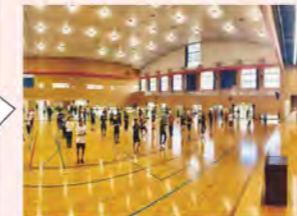
町民ミニバレーボール大会 エアロビックでの準備運動