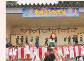
木城ふるさとまつり 国スポキャラバン隊とダンス