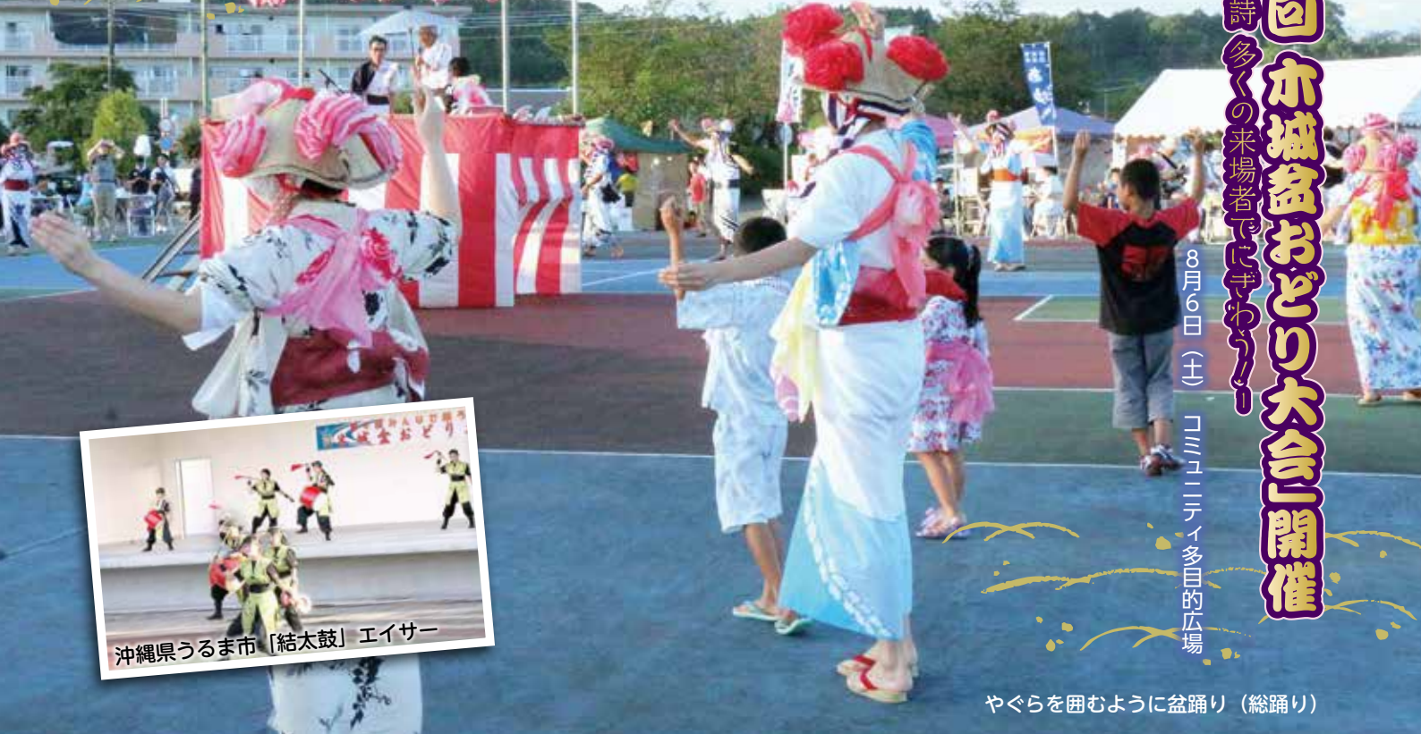
やぐらを囲むように盆踊り(総踊り)