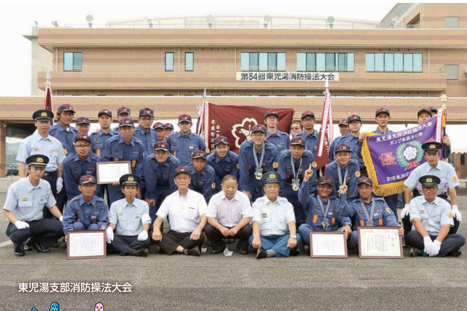
東児湯支部消防操法大会