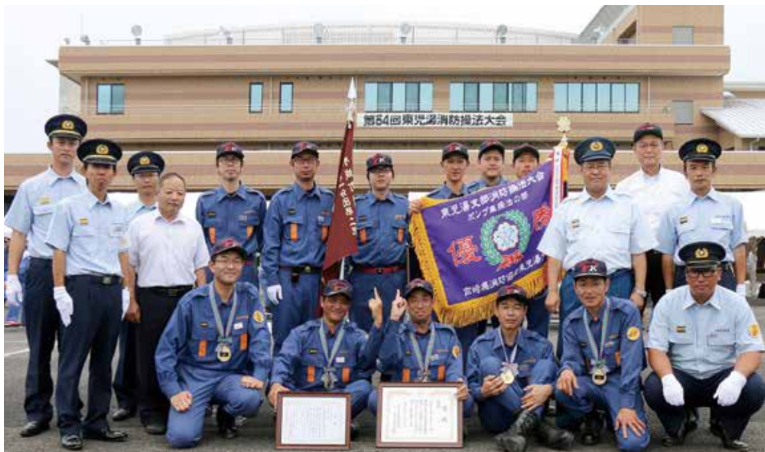
ポンプ車操法の部で優勝 第1分団第2部

出場した3つの部とも入賞を果たす、素晴らしい成績を収めました。なお、優勝した第1分団第2部は、8月27日に開催される県大会に東児湯支部の代表として出場することになります。皆様の応援をよろしくお願いします。