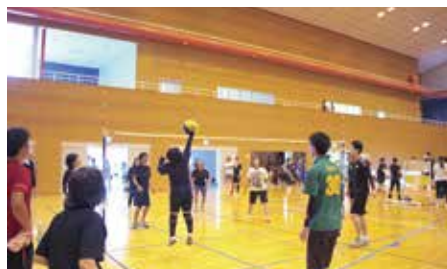
白熱した試合の様子