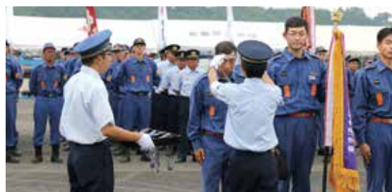
優勝した第1分団第2部に東児湯支部長からメダルの贈呈

出場した3つの部とも入賞を果たす、素晴らしい成績を収めました。なお、優勝した第1分団第2部は、8月27日に開催される県大会に東児湯支部の代表として出場することになります。皆様の応援をよろしくお願いします。