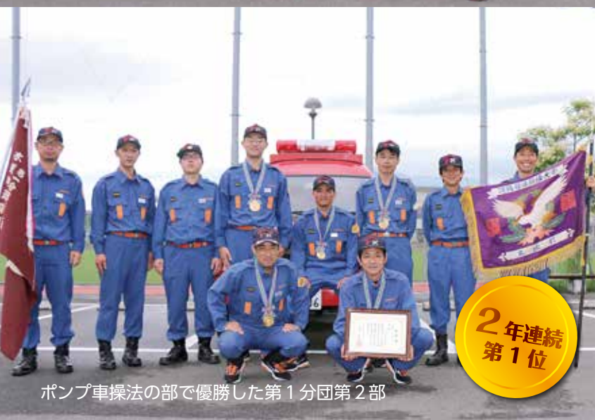
ポンプ車操法の部で優勝した第1分団第2部