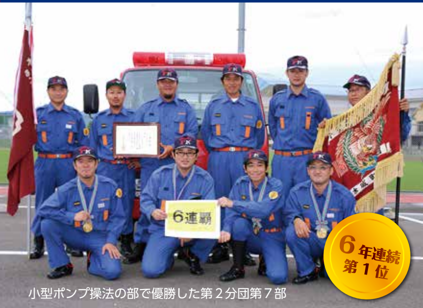
小型ポンプ操法の部で優勝した第2分団第7部

今年の大会も、消防団員の気合の入った操法競技が披露されました。雨の日も各部団員は、夜遅くまで練習を重ねてきました。本番では操法技術を一生懸命に堂々と披露し、素晴らしい大会となりました。また、今大会においても木城町地域婦人連絡協議会の皆様から飲み物を提供していただきました。ありがとうございました。