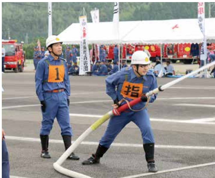
気合の入った操法を披露する第2分団第7部