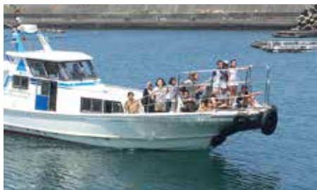
クルージング体験