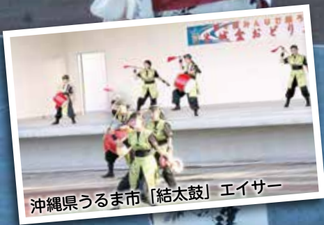
沖縄県うるま市「結太鼓」エイサー

桜の苗木を寄贈していただきました —宮崎トヨペットふれあいグリーンキャンペーン—