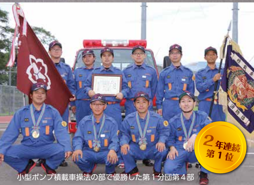
小型ポンプ積載車操法の部で優勝した第1分団第4部