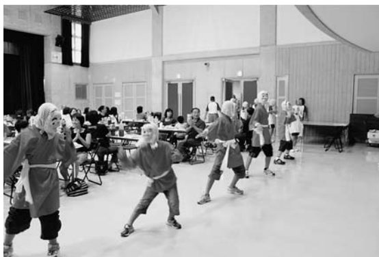
どう?この腰使い!! 【交流会】