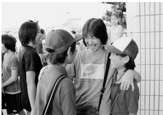
いちゃりばちょ～で～!! (みな兄弟)