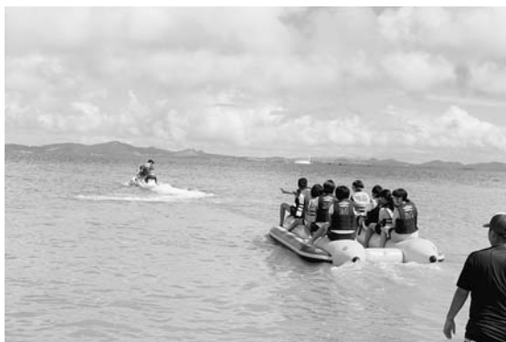
沖縄の海を満喫中! 【海中道路ビーチ】