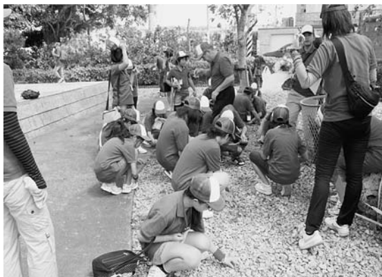
清掃と献花をしました。【ひむかいの塔】