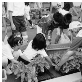
(景観美化活動) 『みんなで協力!』

景観美化活動では、町体育館横の歩道に花の寄せ植えをしたプランターを並べました。私たちが使う施設をきれいに飾り、町民のみなさんにも気持ちよく使ってほしい...、という気持ちをこめて作業しました。