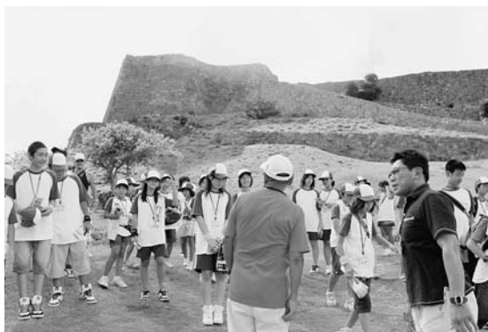
え～あれに登るの! 【勝連城跡/世界遺産】