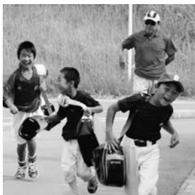
(防犯・不審者対策講習会) 『不審者にあったら 引き返す事が大事』

9月12日(土)に木城スポーツ少年団本部フェスタを町体育館で開催しました。フェスタのプログラムは木城駐在所迫分所長と、防犯アドバイザーによる実技を交えた講習会で、防犯の意識を高めました。