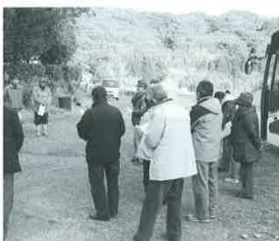
熊本県白小野地区視察研修受け入れの様子 (1月23日)

同じ問題を抱える県内外からの地域や団体が、駄留地区の取り組みに対し視察に訪れます。今年度は1月末現在で7件の団体が視察に訪れています。