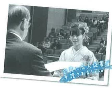
全員に成人證書 手渡されました。