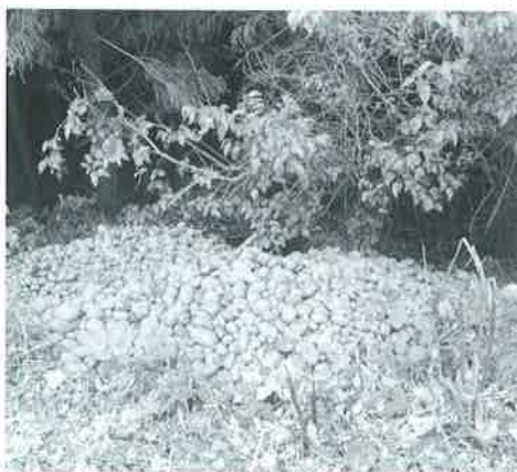
鳥獣が食べにくる畑に捨てられた作物