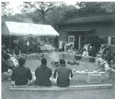
けものを食べよう会 (11月9日)

今年で3回目になるこの行事は、「敵である鳥獣を逆に食べてやろう」というもので、猪鍋を囲んで地域住民相互の意見交換・交流を図っています。