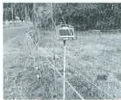
←国の補助事業で導入したソーラー電池式の電気ネット柵

鳥獣が隠れたり、こちらの様子をつかがうことのできるスペースをつくらないよう山林と田畑との境界の茂みや木の枝、竹などを伐採する作業を定期的に行っています。