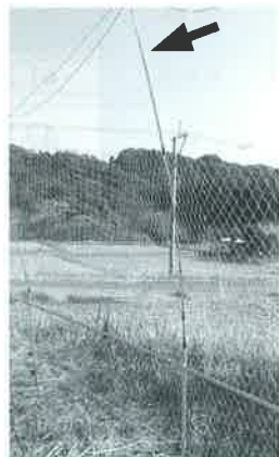
猿落君(えんらくくん)