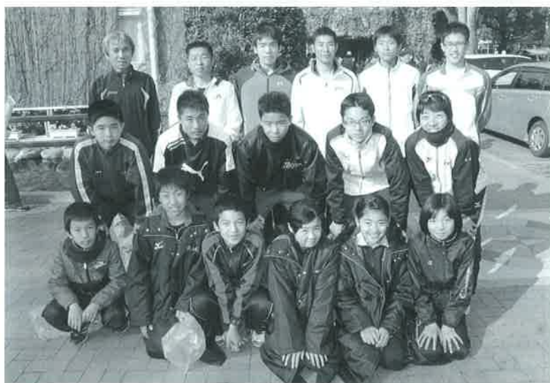
木城町選手団のみなさん