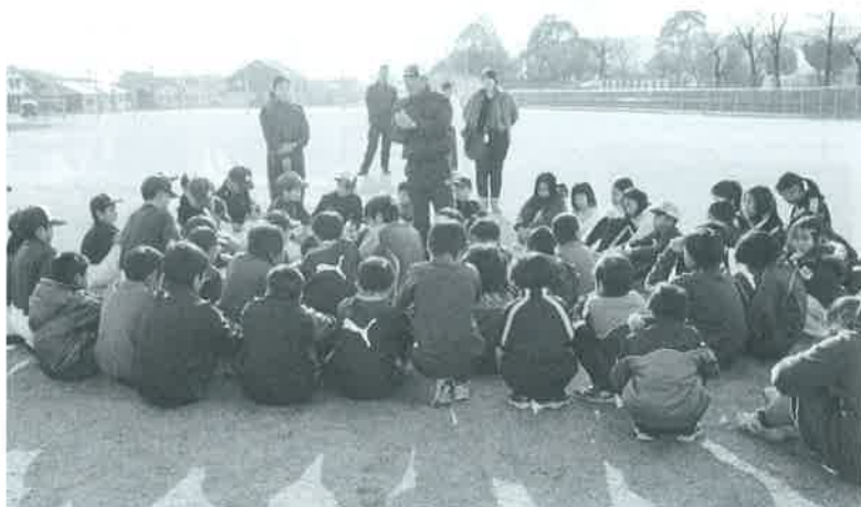
少年団フェスタの様子