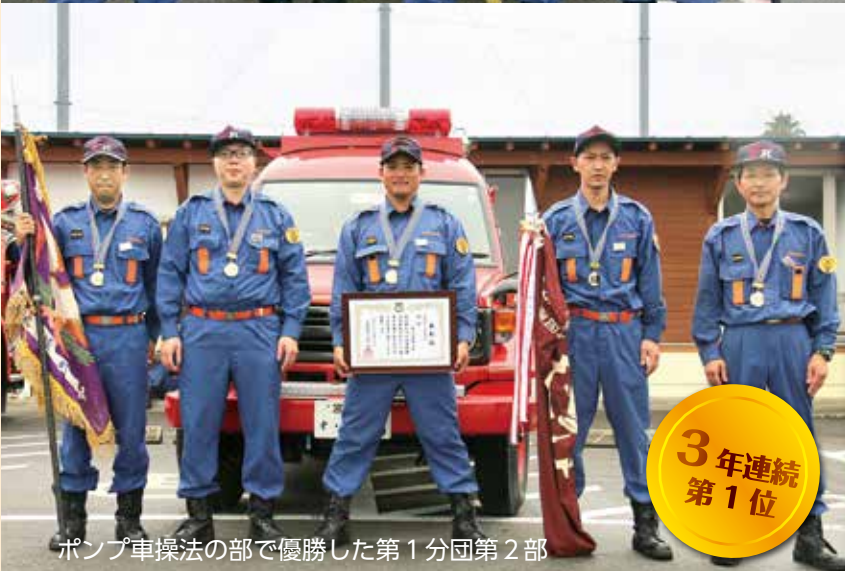
ポンプ車操法の部で優勝した第1分団第2部