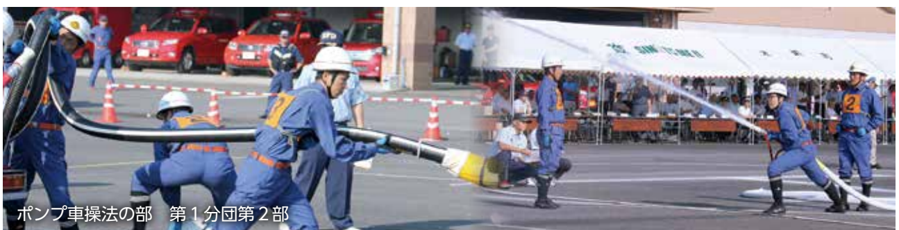
ポンプ車操法の部 第 1 分団第 2 部