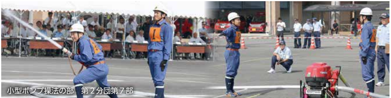
小型ポンプ操法の部 第 2 分団第 7 部

町大会で優勝した 3 つの部が東児湯支部消防操法大会に出場しました。暑さが一層厳しさを増す中、さらに訓練を重ね、各部は支部大会で東児湯代表を競い合いました。各部、惜しくも入賞は逃しましたが、気合の入った操法を披露しました。