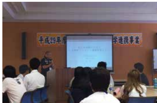
九保大 原先生による町民アンケート調査報告