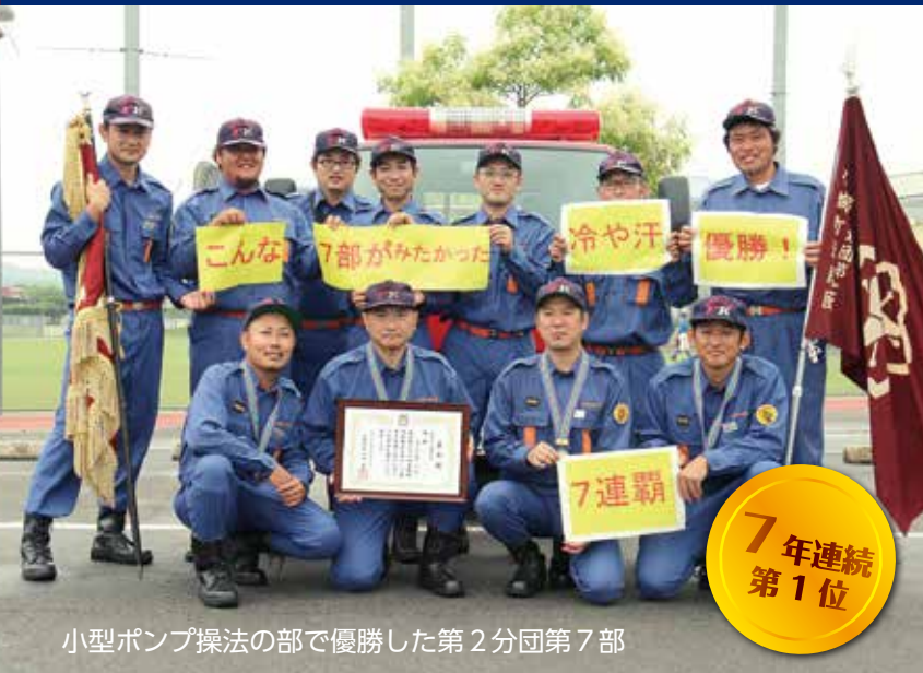
小型ポンプ操法の部で優勝した第2分団第7部

平成 29 年 6 月 24 日 (土) 午前 7 時開会 コミュニティ多目的広場 今年の大会も、消防団員の気合の入った操法が披露されました。雨の日も各部団員は、夜遅くまで練習を重ねてきました。本番では操法技術を一生懸命に堂々と披露し、素晴らしい大会となりました。また、今大会においても木城町地域婦人連絡協議会の皆様から飲み物を提供いただきました。ありがとうございました。