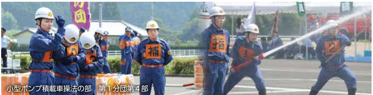
小型ポンプ積載車操法の部 第 1 分団第 4 部