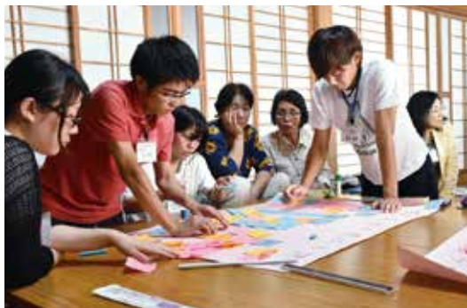
町民聞き取り調査の様子

今後は、今年度連携事業として、12月に学生による地域力調査を行うとともに、子育て世代ニーズ調査、運動機能強化につながる口腔評価など、地域振興及び町民の健康増進・福祉向上につながる調査研究を行う予定です。