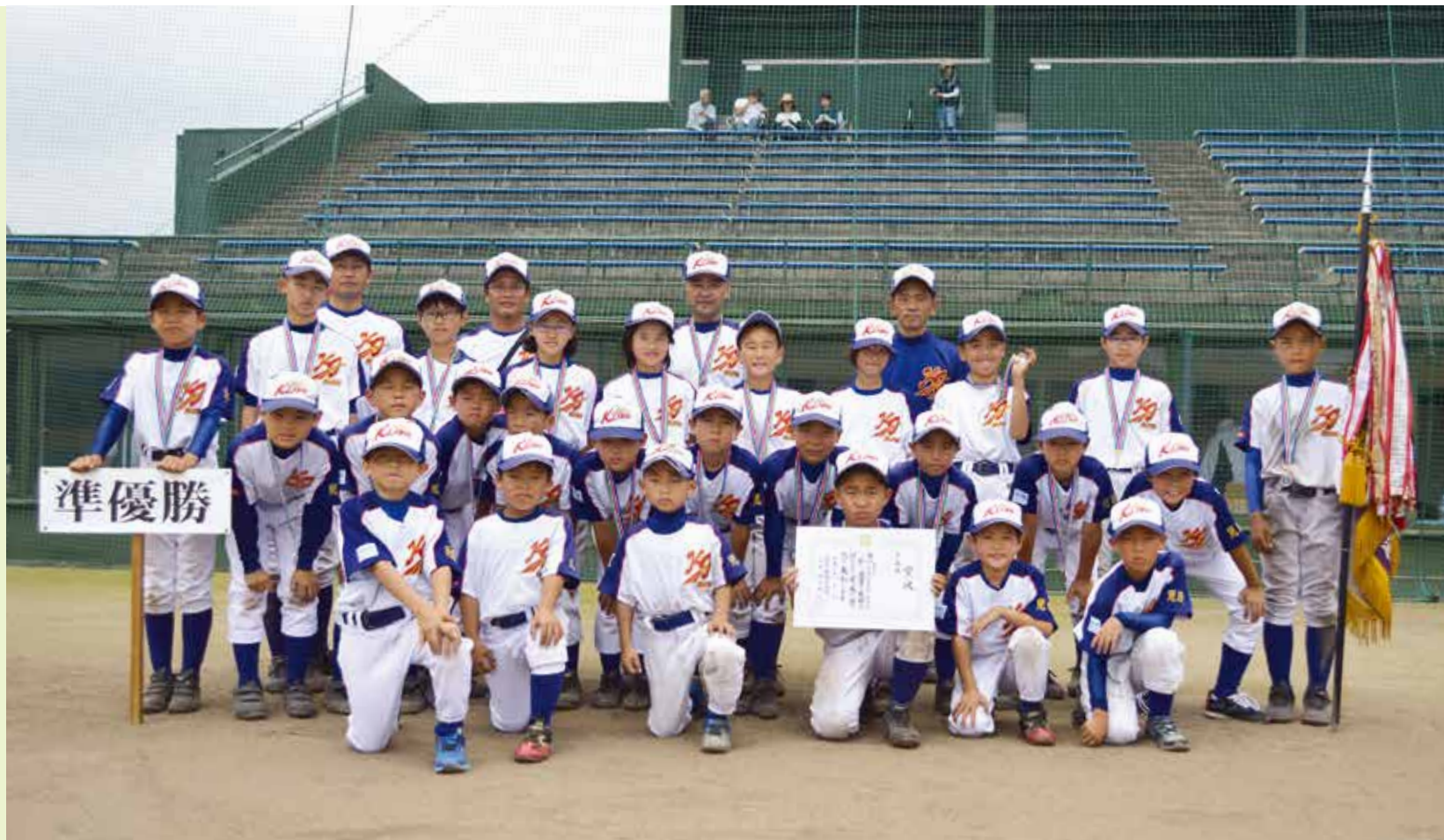
第42回宮崎県若鷺旗争奪少年野球大会準優勝 ～木城野球スポーツ～