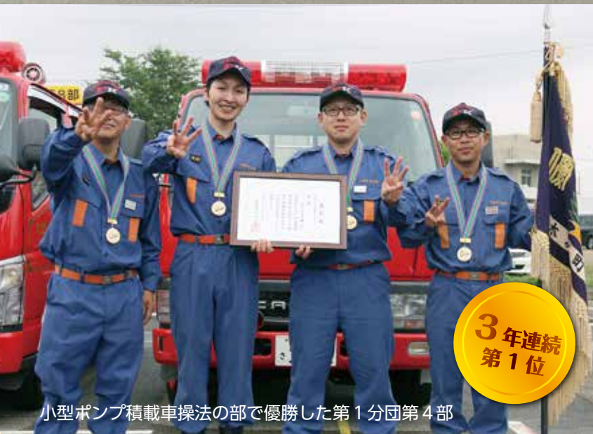
小型ポンプ積載車操法の部で優勝した第1分団第4部