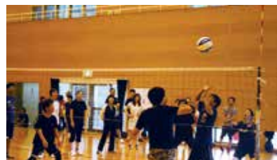
白熱した試合の様子