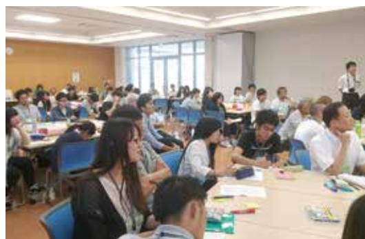
発表を真剣に聞く参加者