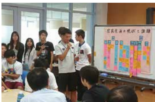
学生による聞き取り調査の分析