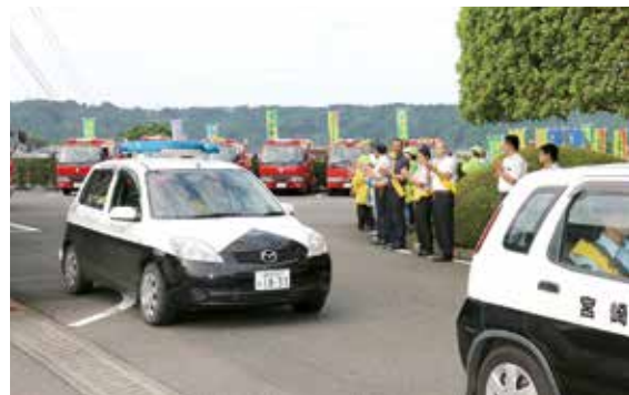
交通安全広報パレード隊出発式

秋の全国交通安全運動（9月21日～30日）に合わせて、木城町交通安全広報パレード隊出発式が行われました。期間中は、子どもと高齢者の交通事故防止を推進するため、通勤・通学時の街頭指導のほか、自動車に対する街頭キャンペーンを実施し、交通安全啓発に取り組みました。本町では、2009年（平成21年）11月5日から死亡事故が発生しておらず、これは県内最長です。これからの時期は、日没が早くなります。ドライバーの皆さんは、早めのライト点灯を心がけましょう。歩行者の皆さんは、反射材を着用しましょう。