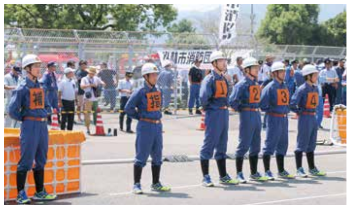
待機線に整列する操法要員