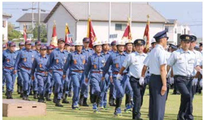
入場行進する第1分団第2部