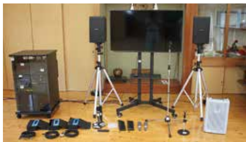
中椎木公民館に導入された音響設備