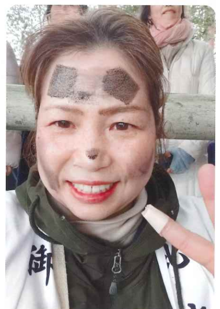
最終日、お別れの悲しみを隠す「ヘグロ塗り」で顔を真っ黒にされました