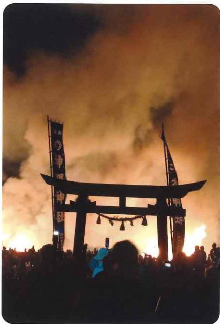
壮大な迎え火の中を歩きました

かけがえのない温情を紡いできた1300年、その歴史の一コマに関われた事に感謝しております。そして未来に繋がるために今後も関わっていけたらと願います。