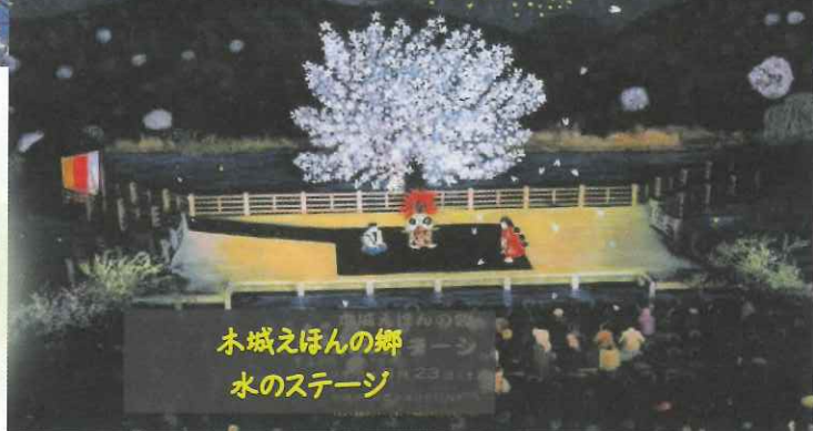
木城えほんの郷 水のステージ