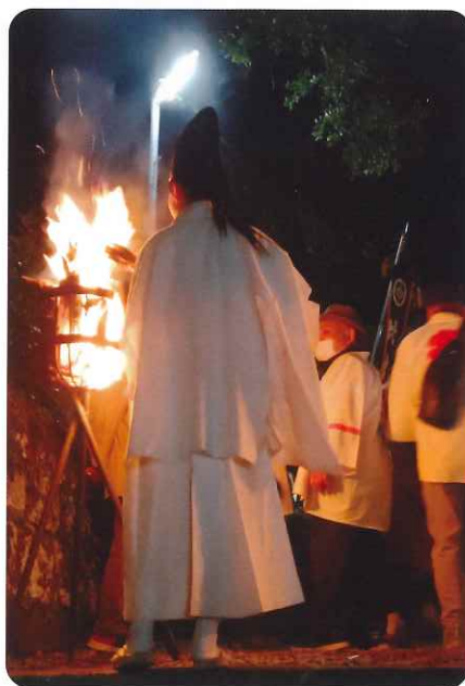
初めての神門神社へ