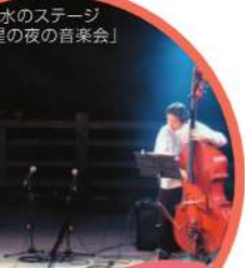
水のステージ 「星の夜の音楽会」