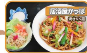
居酒屋 かつば 焼きKK麵