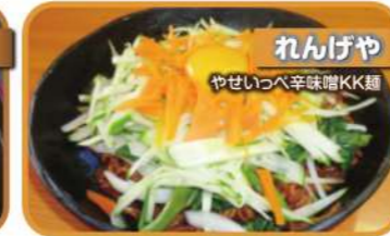
れんげや やせいっぺ辛味噌KK麵