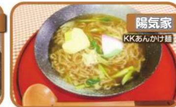
陽気家 KKあんかけ麵