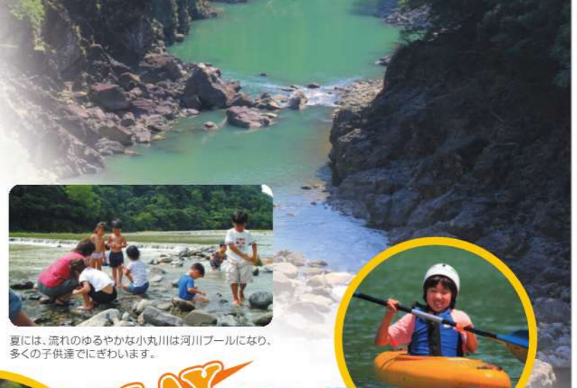
夏には、流れのゆるやかな小丸川は河川プールになり、多くの子供達でにぎわいます。