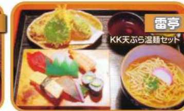
雷亭 KK天ぷら温麵セット