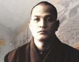
石井十次(いしいじゅういち) 慶応元年(1865)年、宮崎県高鍋町に生まれました。明治15年、17歳の時、岡山県の医学校に入学、23歳の時から児童福祉、教育事業に専念することを決意

もう一人の偉人は、「孤児の父」と謳われる石井十次。日本の福祉事業の先駆者で、中原地区にある石井記念友愛社は、十次の思想を受け継いで創立されました。友愛社は、岡山孤児院の分院として開設されたもので、その一角には、「石井十次資料館」があり、十次の写真パネル、日記、当時の書類などの関係資料2000点が展示されています。人間国宝の芹沢銈介が製作したステンドグラスも一見の価値があります。