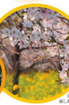
春には公園内に桜や菜の花が咲き、四季を通してのレジャースポットとして、楽しむことができます。