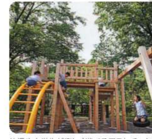
幼児や小学生が楽しく遊べるアスレチックや遊具等も設置されています。