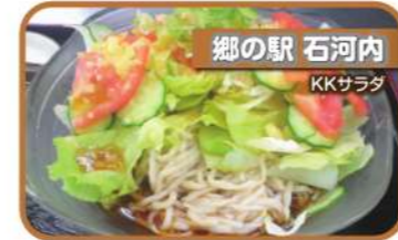
郷の駅 石河内 KKサラダ