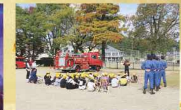
生涯学習のつどい大会 (学校編)