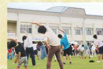
みんなのラジオ体操