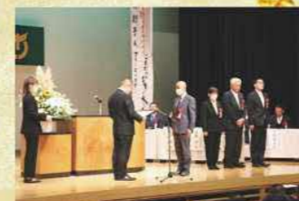
町制施行50周年式典