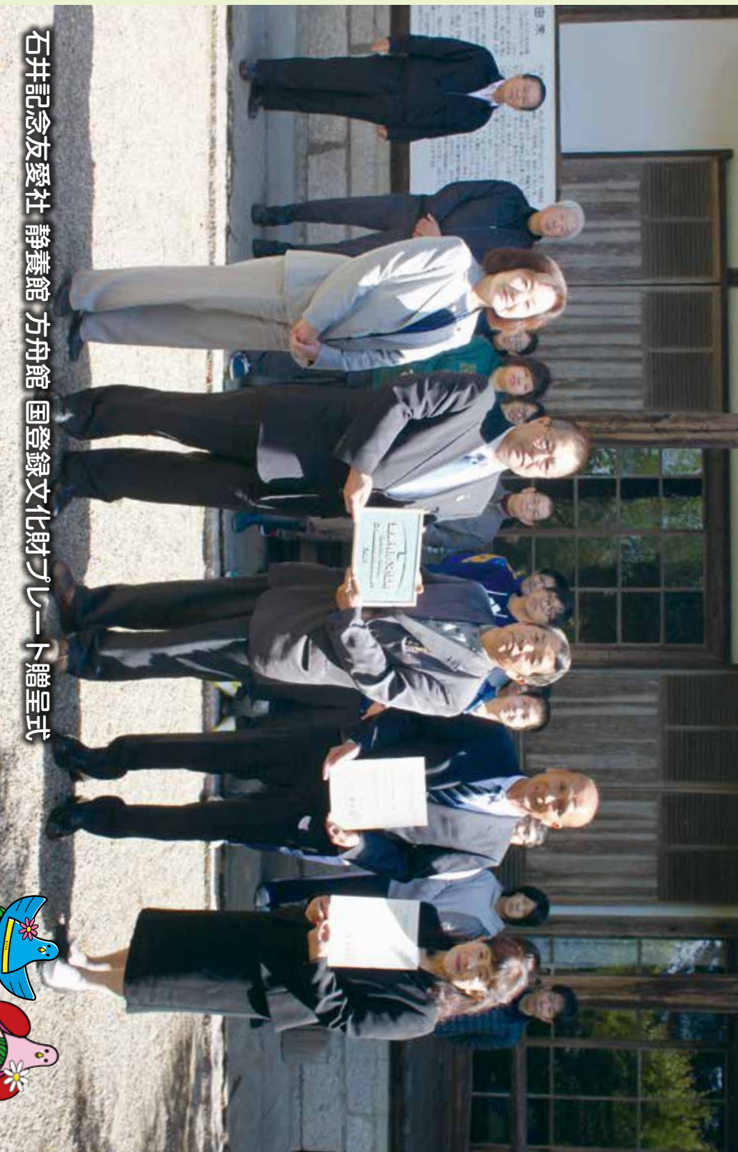
石井記念友愛社 静養館 方舟館 国登録文化財プレート贈呈式