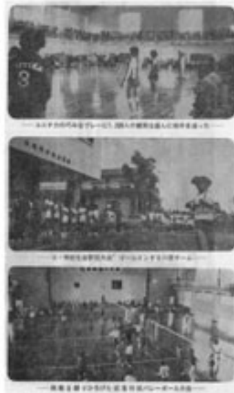
資料「広報きじょう」より

当時の記念行事として4月1日に記念式典並びに祝賀会、2日に当時の全日本女子バレーボールの女王ユニチカバレーチームを招待し、体育館のこけら落としを行いました。その日の午後からは、小中学校の駅伝大会、地区対抗バレーボール大会が行われ、町民一体となって盛り上がったそうです。