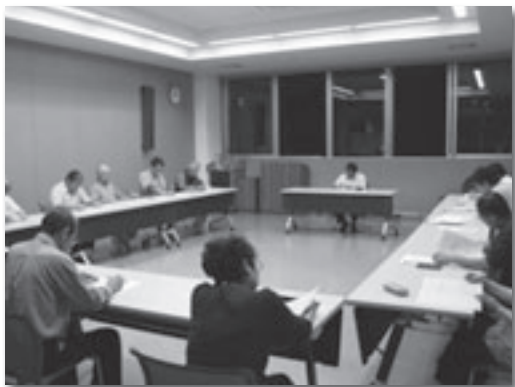
当日の会議の様子

「知」「徳」「体」の調和のとれた青少年の育成を図るため、第1回町地域教育推進プロジェクト会議が開催（6/25）されました。