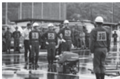
集合ラインにまっすぐ整列