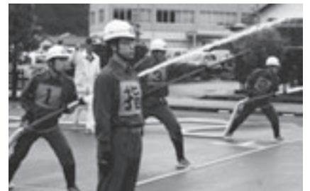
火点を倒し、疲れはピークに達します。