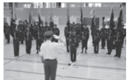
体育館での開会式