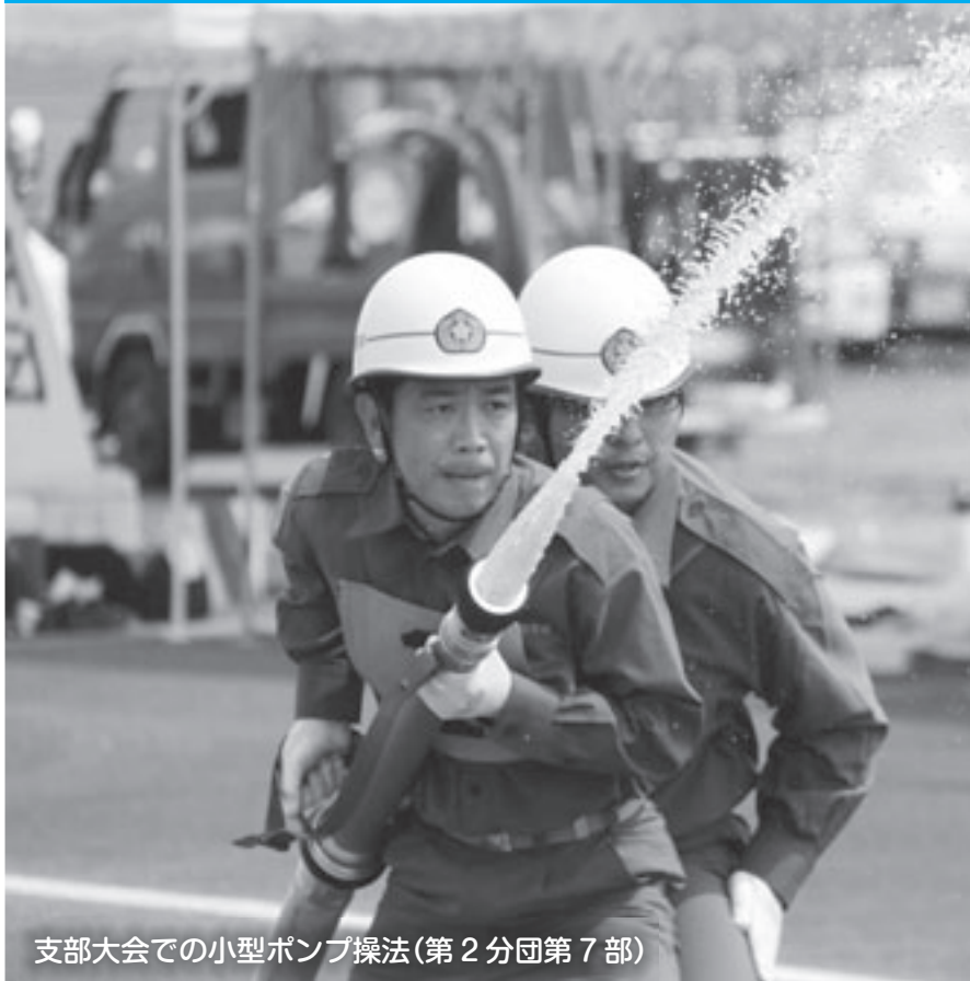
支部大会での小型ポンプ操法(第2分団第7部)

大会当日、6月29日(土)は、朝から激しい雨になり、開会式は町体育館で開催し、操法競技は雨の中、コミュニティ多目的広場で行われました。各部とも雨の日も風の日も夜遅くまで練習してきた操法の技術を遺憾なく発揮し、悪天候の中でも、一生懸命、堂々とした競技を繰り広げ、素晴らしい大会となりました。