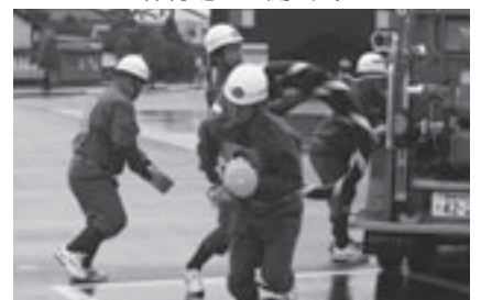
すばやい吸管操作