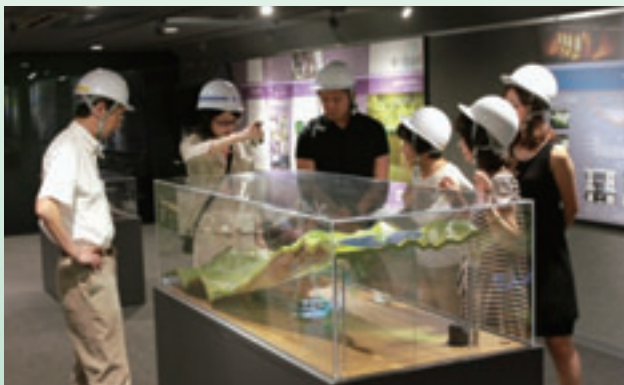
午後から遺族の方々は、小丸川発電所、上部ダム、下部ダムなどを初めて見学されました。