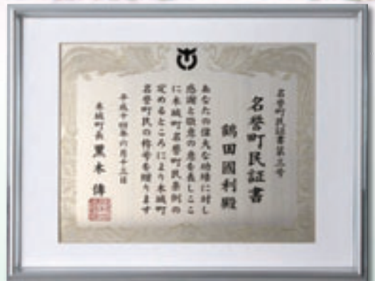
平成 14 年 6 月 木城町名誉町民証書