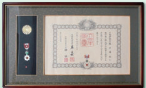
平成 12 年 4 月 勲四等旭日小綬章