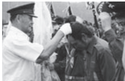
優勝メダルを授与される要員たち