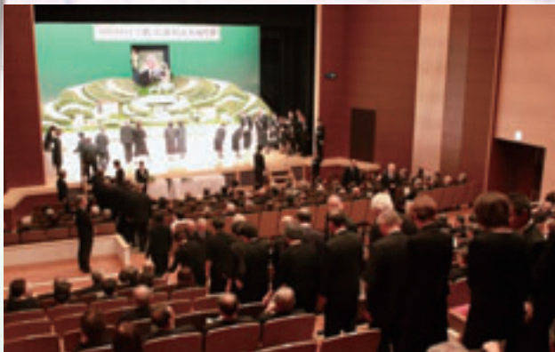
次々と献花を行う参列者の方々