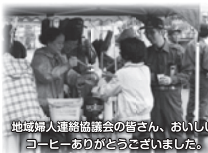
地域婦人連絡協議会の皆さん、おいしいコーヒーありがとうございました。