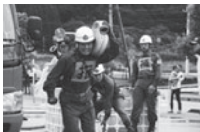
一生懸命に走る0.1秒でも早く