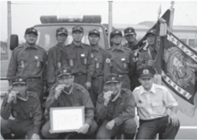
管轄 大字高城(中川原、田神、岩戸除く)