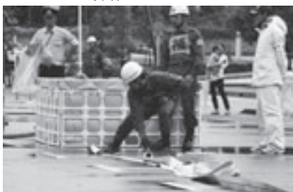
まっすぐにホースを伸ばす