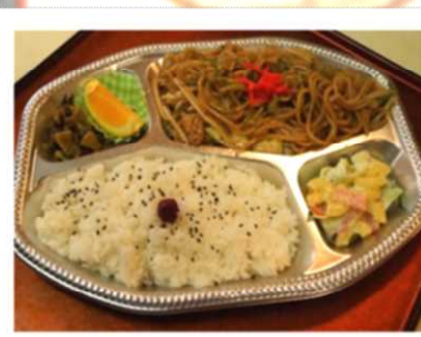
焼きそば弁当 550 円税込