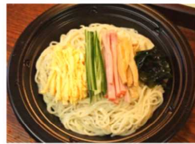
冷やし中華 550 円税込