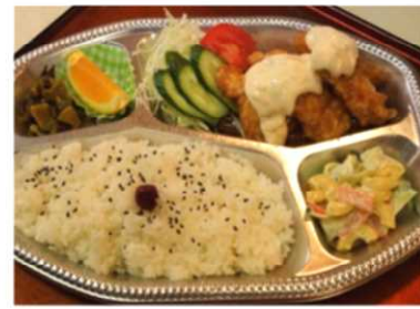
チキン南蛮弁当 550 円税込