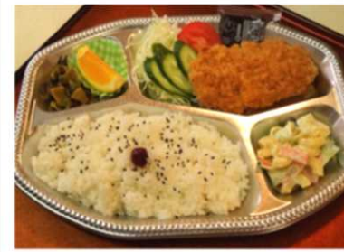
トンカツ弁当 550 円税込