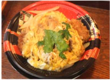
かつ丼 550 円税込