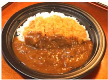
カツカレー 700 円税込