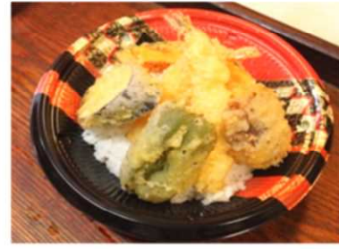
天丼 550 円税